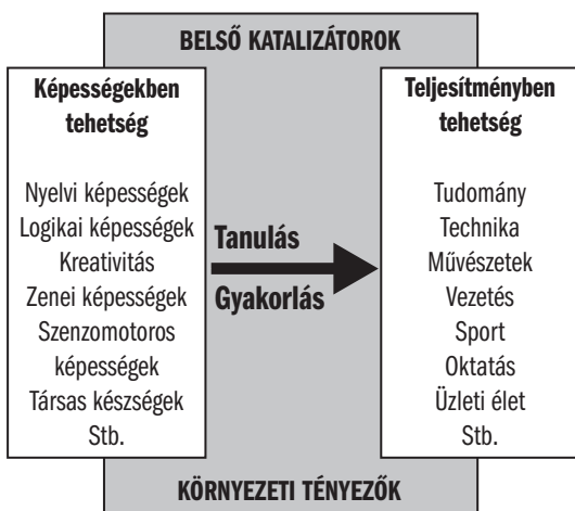
3. ábra: Gagné „megkülönböztető modellje”

Sternberg és Davidson (1986) szerint a tehetséget nem felfedezzük, hanem feltaláljuk. A tehetséget az adott kor választja ki magának. A külső tényezők – a társadalom és a kultúra, az oktatás, a család – meghatározzák, hogy milyen tehetség az, amely utat tud magának törni. Ezért a tehetség koronként, társadalmakként és kultúránként eltérő lehet.